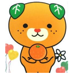
みきゃん 愛媛県キャラクター

日時 令和6年1月27日(土)、28日(日) 会場 愛媛県民文化会館他 日程 1月26日(金) 松山へ移動、松山(泊) 27日(土) 分科会、松山(泊) 28日(日) 式典、京都着 費用 約6万5千円(交通費、宿泊、大会参加費、懇親会費等) (本部より半額程度の助成を予定)