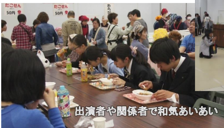
出演者や関係者で和気あいあい